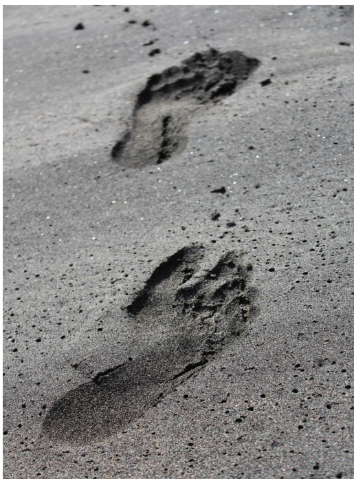
相片主題：足印